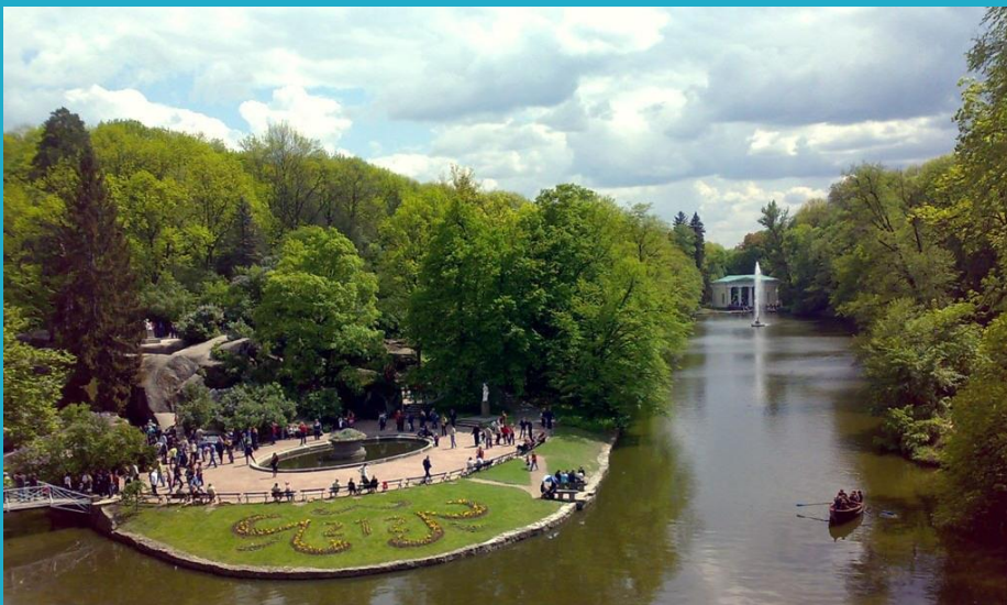
Парк Софіївка в Умані