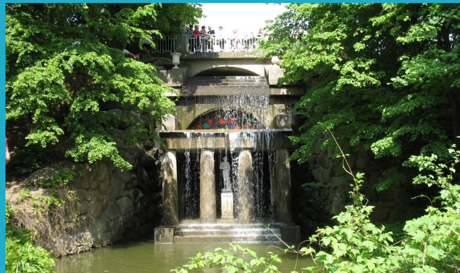
Парк Софіївка в Умані