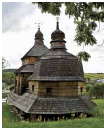
1502. aastal ehitati naelu kasutamata Püha Vaimu kirik.