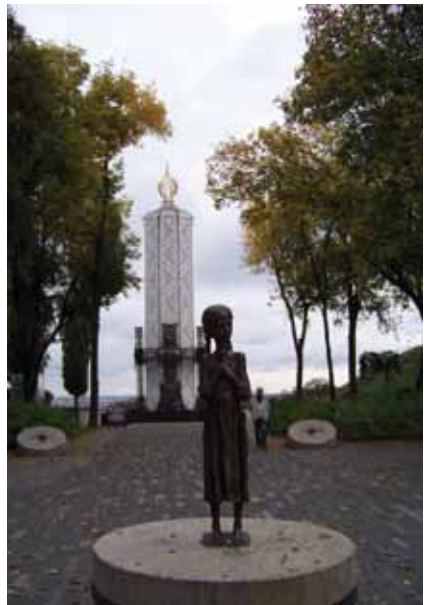
Näljahäda ohvrite memoriaal Kiievis.

1960-ndatel aastatel levis riigis dissidentlik liikumine: astuti välja ühiskonna demokratiseerimise, inimõiguste ja ukraina keele vaba arengu