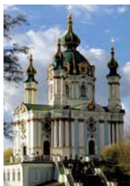
Püha Andri kirik.