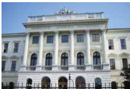
Lvivi polütehniline ülikool.

Praegu tegutseb Ukrainas 104 riiklikku ülikooli.