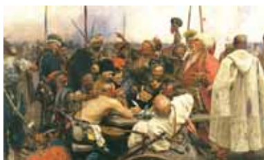
Ilja Repini maal „Zaporoožlased kirjutavad kirja Türgi sultanile”

Tuntud on Ilja Repini maal „Zaporoožlased kirjutavad kirja Türgi sultanile”. Pildil kujutatud värvikad tegelased kirjutavad kirja vaenlase võimsale valitsejale ja naeravad sealjuures nii, et küllap väriseb isegi Türgis maa ja koos sellega Türgi sõjavägi... Kasakas lõbusa naljata on sama, mis kasakas mõõga või vuntsideta: ei saa lahingut võita ega pulmas pidutseda.