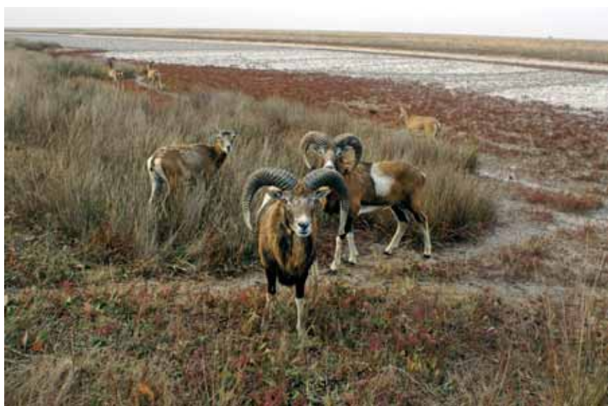
Muflonid Aasovi-Sõvaši looduspargis.

Ukraina on hinnatud turismipiirkond. Tuntud on Krimmi lõunakaldal asuvad kuurordid (Jalta, Jevpatorija, Alušta) ning Odessa. Populaarsust on kogunud vesi- ja mudaravilad – Truskavets, Moršõn, Mõrgorod, Sakõ, Slovjansk, ning