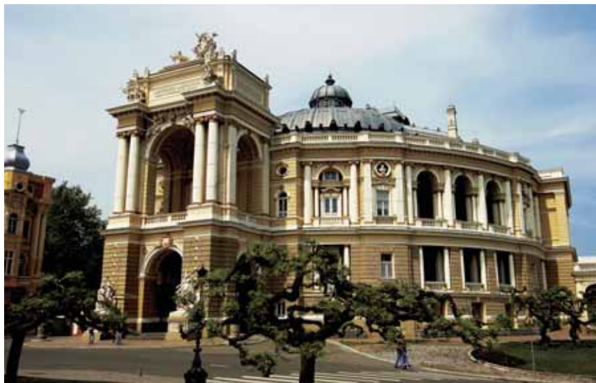
Odessa Riiklik Akadeemiline Ooperi- ja Balletiteater.

Ukrainas töötab praegu kuus ooperi- ja balletiteatrit: Kiievis, Lvivis, Donetskis, Odessas, Harkivis ja Dnipropetrovskis.