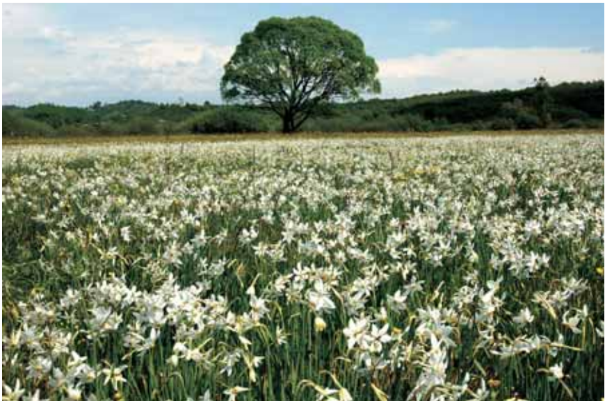
Imeline Nartsisside org.

Karpaatide pöögimetsad on aga kantud UNESCO maailmapärandi nimekirja.