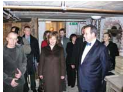
Eesti president Toomas Hendrik Ilves kohtub siinsete ukrainlastega.

Ukraina Organisatsioonide Assotsiatsioon Eestis asub Tallinnas Ukraina saatkonna ja Kadrioru pargi lähistel. Organisatsiooni juures tegutsevad pühapäevakool Nadija, muusika- ja vokaalkool. Korraldatakse kursusi ja seminare täiskasvanutele ning noortele, rahvakunsti püsinäitusi, töötab raamatukogu. Aset leiavad kohtumised Eesti, Euroopa ja Ukraina riigiametnike ja kultuuritegelastega.