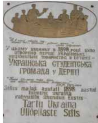
Mälestustahvel üiõpilaste gromaada kohtumisaigaks.

Ukraina saatkonna toetusel on paigaldatud mälestustahvel Tartus Tähtvere 16 asuvale majale. Just seal toimusid Dorpati Ukraina Üliõpilaste