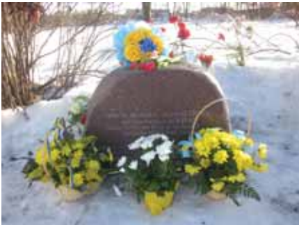
Mälestuskivi Tarass Sevtšenkole.