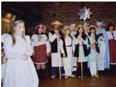
Jõulude ajal esitavad noored traditsioonilise jõulunäidendi.

Lastele ja noortele korraldatakse Eesti eri paikades suve- ja talvelaagreid, laagreid organiseerib ka ukraina kirik. Lastel on samuti võimalus külastada Ukraina laagreid, kus nad saavad tunda oma ajaloolist kodumaad. Oodatud on Krimmis rahvusvahelises Arteki laagris toimuv festival „Me oleme sinu lapsed, Ukraina”. Eestis leiab aga 2001. aastast aset rahvusvaheline laste- ja noortefestival „Ukraina lilled”.