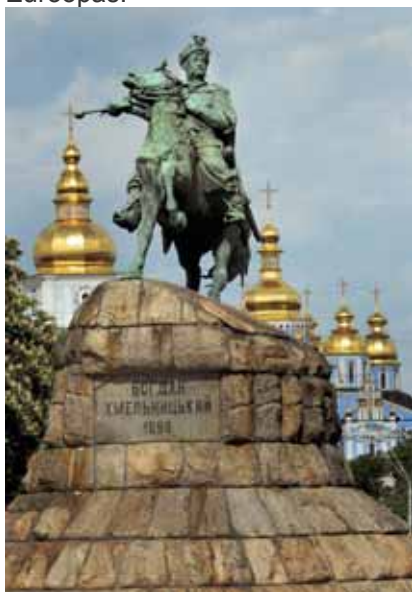
Mälestusmärk Bogdan Hmelnõtskile Kiiemis.

Aja möödudes võis kasakaid leida kõikjal Ukrainas. Aastail 1591–1632 toimus mitmeid kasakate ja talupoegade ülestõuse, mis nurjusid või lõppesid kompromissiga. Aastail 1648–1657 vabastasid kasakate väed eesotsas hetman Bogdan Hmelnõtskiga suurema osa Ukrainast Poola võimu alt ja moodustasid Kasakate riigi. Pärast Bogdan Hmelnõtski surma algas sõdade ja sisetülide periood, mida kasutasid ära Rzeczpospolita ja Moskva riik. Ukraina jagati Dnipro jõe aluseks võttes Paremkalda- ja Vasakalda-Ukrainaks, viimast hakati nimetama Hetmanštšõnaks. Paremkalda-Ukraina üks hetman, Põlöp Orłõk koostas 1710. aastal Ukraina esimese põhiseaduse, mida ühtlasi peetakse üheks esimeseks põhiseaduseks Euroopas.