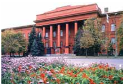
Tarass Sevtšenko nimeline riiklik ülikool