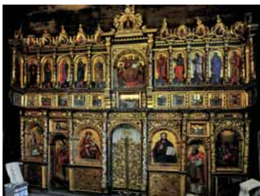
Jumalaema kiriku ikonostaas (Kutõ küla).

XVII sajandi lõpu–XVIII sajandi alguse renessansi- ja barokiajastust on säilinud