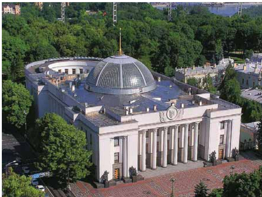
Ukraina parlamendi hoone.

Diplomaatilised suhted Eestiga sõlmiti 4. jaanuaril 1992.