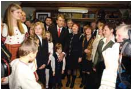
Ukraina president Viktor Juštšenko külas siinsetel ukrainlastel.

Ukraina Kultuurikeskus Tallinnas jagab vanalinnas ühist territooriumi Ukraina kreekakatoliku kirikuga ja moodustab osa sakraal- ja kultuuri-kompleksist. See kompleks on otsekuu ukraina kultuuri näide ja samas Tallinna keskaegse arhitektuuri lahutamatu osa. Kultuurikeskuse ruume kasutavad Eesti Ukrainlaste Kongressi organisatsioonid. Seal tegutsevad ka pühapäevakool Labora, käsitöö ja kloostrikunstide kool, raamatukogu ja muuseum. Samuti on keskuses sisustatud töökoda, kus keskaegset tehnoloogiat kasutades valmistatakse käsitsi paberit. Kultuurikeskus korraldab ukraina keele ja kalligraafia kursusi, toimuvad käsitöö, paberivalmistamise ja teisedki meistriklässid. 2005. aastal külastas Ukraina Kultuurikeskust Tallinnas Eesti president Arnold Rüütel abikaasaga, 2006. aastal olid külalisteks Eesti president Toomas Hendrik Ilves ja Ukraina president Viktor Juštšenko, 2007. aastal tutvus keskusega Eesti peaminister Andrus Ansip.