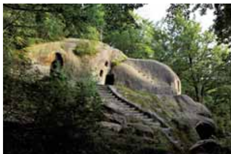
Kaljuklooster, mida esmakordselt on mainitud 1460. aastal.

Kristlus võeti ametlikult vastu 988. aastal vürsti Volodõmõr Suure ajal.