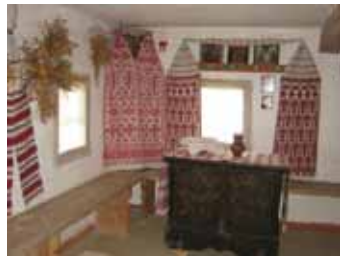
Ukraina maja seestpoolt.