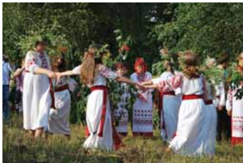
Ivana Kupala püha.

Ööl vastu 7. juulit tähistavad ukrainlased iidsetest aegadest Ivana Kupala püha, see langeb kokku Ristija Johannese pühaga. Tütarlapsed punuvad sel päeval põllulilledest pärgi, viskavad need õhtul vette ja jälgivad tähelepanelikult nende liikumist. Kui pärg ujub kenasti, saab tütarlaps aasta jooksul mehele; kui pärg keerleb ühe koha peal, pole meheleminekut veel mõnda aega oodata; kui aga pärg ujub kaldale, on sealtkandist peigmeest oodata juba samal ööl. Julgemad otsisid sõnajalaõit, mis avanes legendi