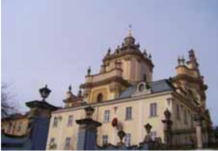
Püha Jüri katedraal.